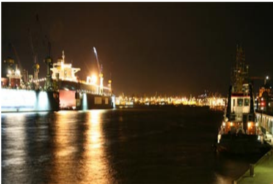
Blende 5,6; Belichtung 1/250 Sekunde