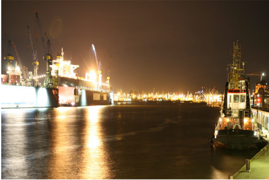
Blende 4; Belichtung 1/500 Sekunde – nahezu identisches Ergebnis wie mit