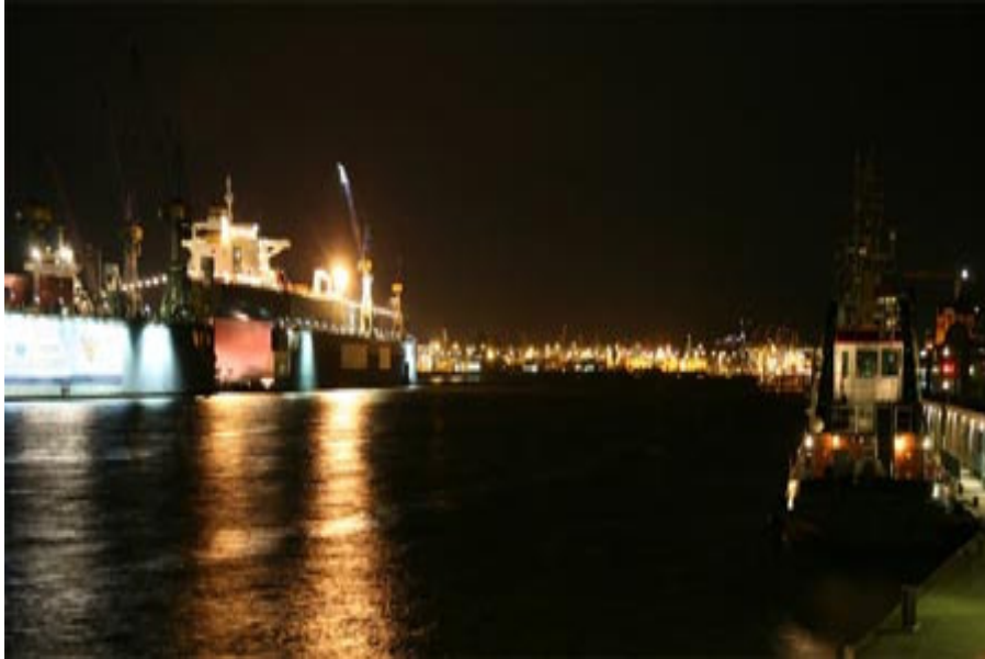
Belichtungszeit 1/200 Sekunde – das Wasser ist eingefroren