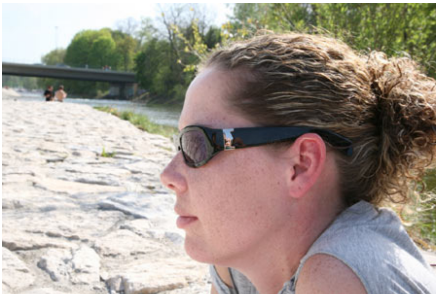
Blende 22 – Große Teile des Hintergrunds werden schärfer