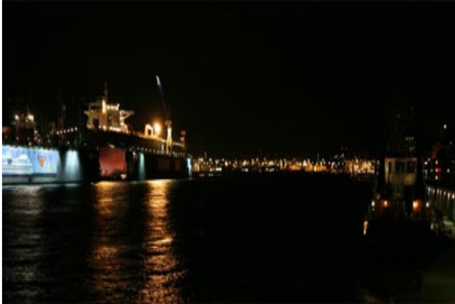
Blende 4 – der Hintergrund ist komplett unscharf