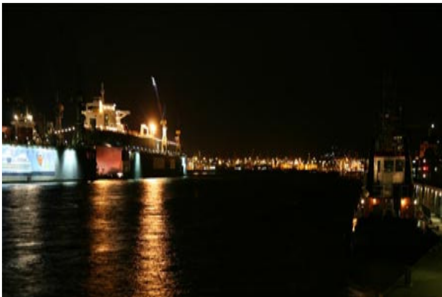
Belichtungszeit 1/13 Sekunde – das Wasser ist verschwommen, der Eindruck des fließenden Wassers wird bestärkt.